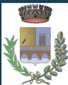
Comune di Roncadelle Assessorato alla Cultura

Ogni LUNEDÌ dal 19 GENNAIO 2026 nella Sala della BIBLIOTECA di RONCADELLE dalle 14:30 alle 16:00